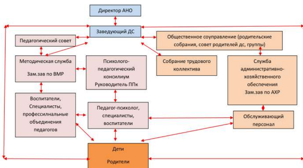
Рис. 1. Система управления детским садом

Данная структура управления позволила обеспечить координацию деятельности педагогической, и психологической служб детского сада. В результате эффективного взаимодействия были успешно решены вопросы, связанные с соблюдением санитарного режима по назначению врача, организацией мероприятия по закаливанию детей; обеспечением организации оздоровительных мероприятий, соблюдением режима дня, правильным проведением утренней гимнастики, физкультурных занятий и прогулок детей и другое.